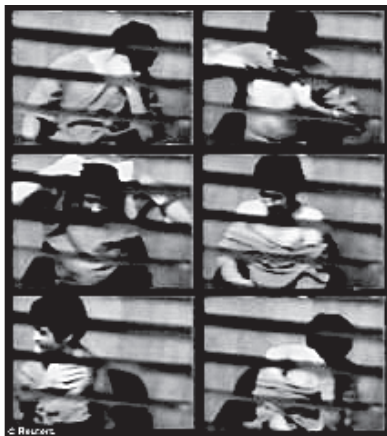
Omar Khadr - interrogé par le SCRS à Guantanamo.

Le SCRS travaille aussi avec des gouvernements et des institutions étrangères pour recueillir et échanger de l'information. Selon Le Devoir , en mai 2010 le SCRS avait des accords de partage d'information avec 147 pays.